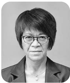
とり ぐえ ま ゆ み 鳥越真由美議員