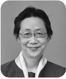
ないとうけいこ 内藤圭子議員