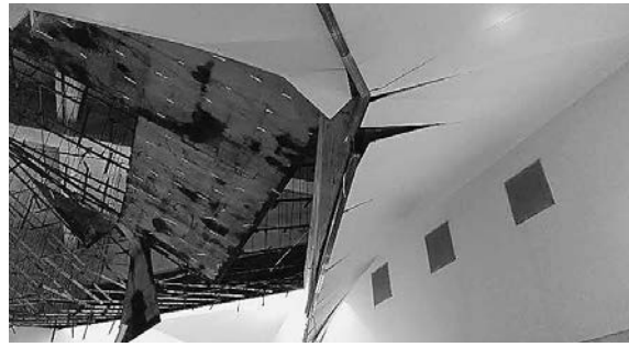
崩落したぬくもりの湯の天井

ありませんでした。落下の原因は経年劣化により軽量鉄骨が腐食し落下したものと考えられ、今後は材料などを見直し落下防止対策・安全対策をしっかりと行い、安心して入浴いただけるよう対策を講じます。