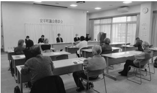
追分ぬくもりセンター会場

今回の懇談会では、全体を通してラピダスの進出による今後の環境と住民生活に関するご質問や、町の広報紙やあびらチャンネル等の広報に関するご質問、道路や水道などの生活基盤となる設備に関するご質問、町の公共交通に関するご質問、議会や議員活動に対するご質問など、議会や町政に関する幅広い内容のご質問をいただきました。