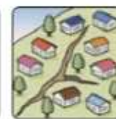
地面にひび割れができる