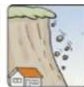
小石がバラバラ落ちてくる