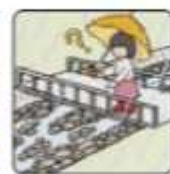
雨が降り続けているのに川の水位が下がる