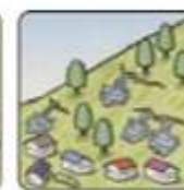
斜面から水がふき出す