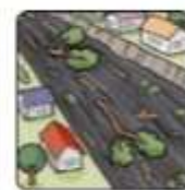
川の流れが濁り流木が混ざりはじめる