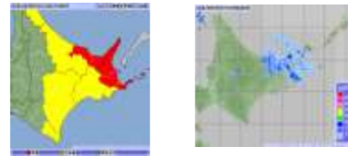
～雨の強さと災害の発生状況～