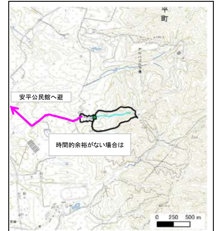
位置図 (図の上位が北を示す)