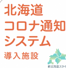
「北海道コロナ通知システム導入施設」のステッカーデザイン