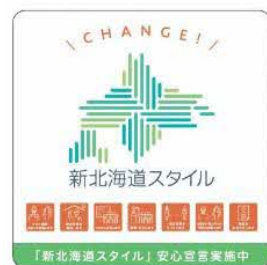
「新北海道スタイル安心宣言実施中」のステッカーデザイン