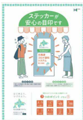
店頭掲示用ポスターデザイン